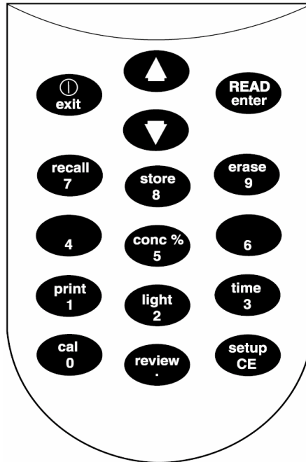
表 1 按键及功能